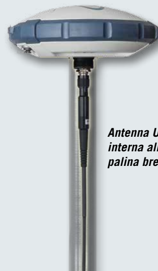
Antenna UHF interna alla palina brevettata